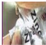
Gambar 3 : Cara pemberian obat zinc

Larutkan tablet zinc kedalam satu sendok air kinum atau ASI