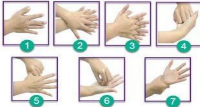
Gambar 4 : mencuci tangan yang benar