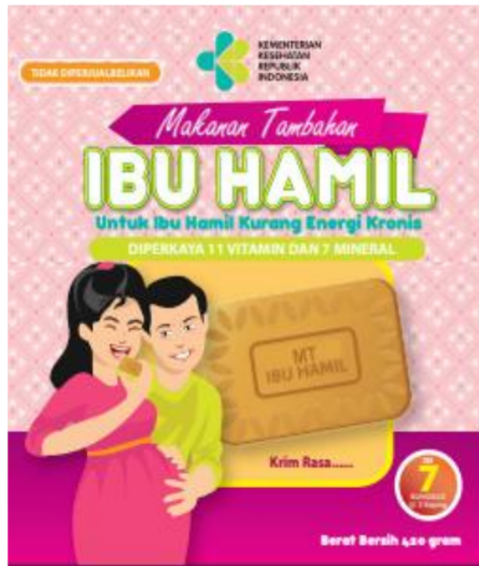
Gambar 1 : kemasan PMT